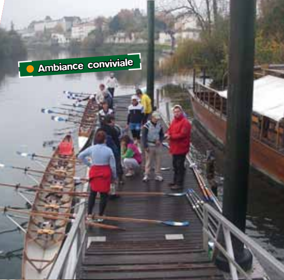
● Ambiance conviviale