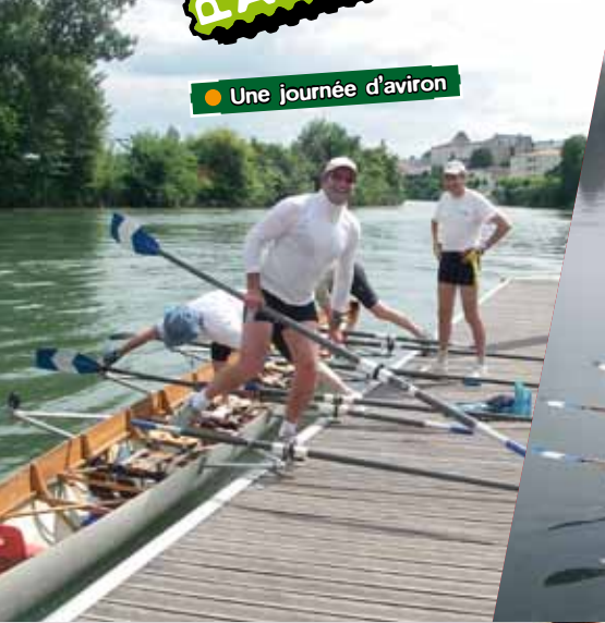
● Une journée d'aviron