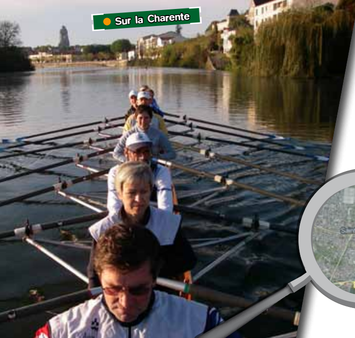
● Sur la Charente

Club d'Aviron Saintsais 6 rue de Courbiac 17100 SAINTES